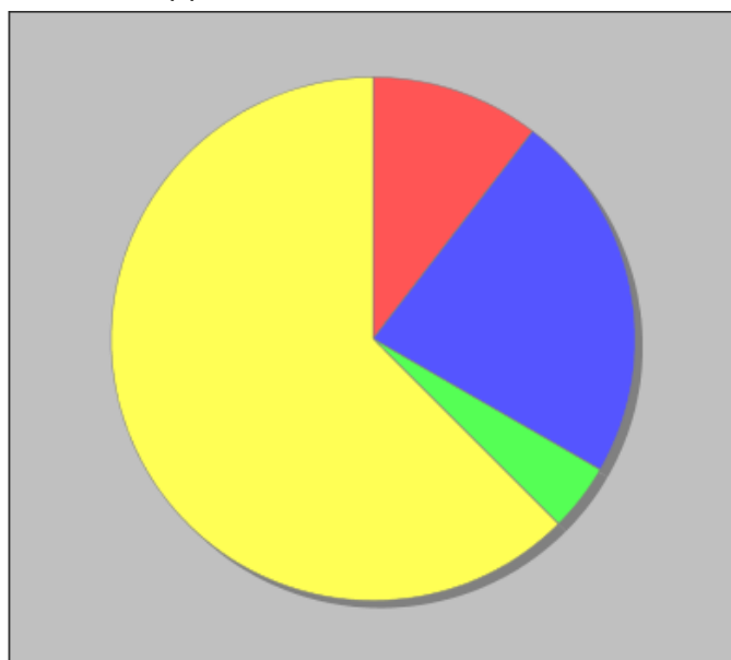
Distribuzione dei docenti a T.I. per anzianità nel ruolo di appartenenza (riferita all'ultimo ruolo)